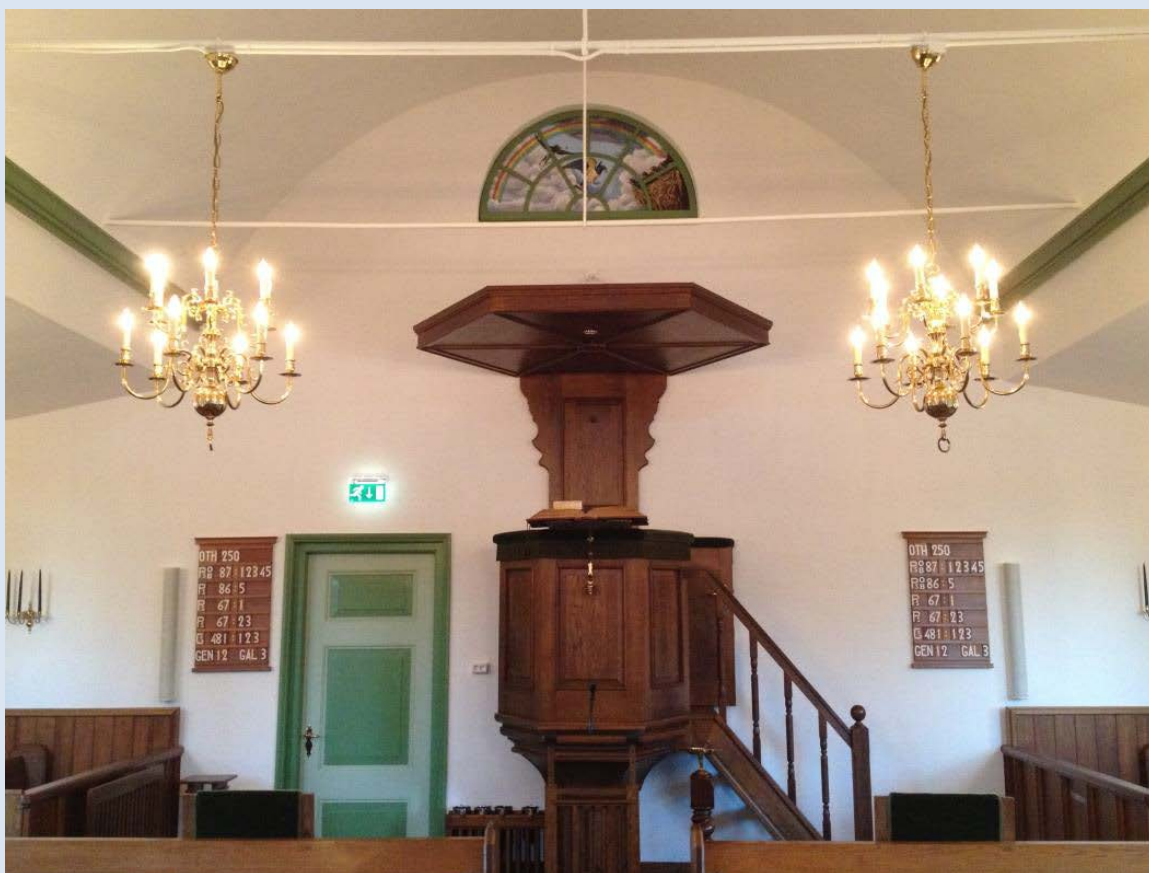
Interieur Efrathakerk (gebouwd 1873), kerkgebouw van de wijkgemeente Overberg

Door de kerkenraad van de hervormde wijkgemeente Overberg, van de Protestantse Gemeente Amerongen-Overberg definitief vastgesteld op 15 februari 2017.